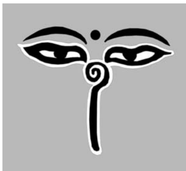
Рис. 4. Часто встречающееся изображение на тибетских ступах.

ды, приносимые прекрасными деревьями, не пили чудесных напитков, приготовленных самыми прекрасными девами. В те времена пищу готовили самые достойные девушки, чистые и невинные, чтобы все те, кто вкушал пищу, не осквернялись от мыслей, которые бродят в голове у зрелых женщин, познавших мужчин. И когда вкушают чистую пищу, то помыслы у всех остаются чистыми, не искажаются мыслями тех, кто готовил еду. Так вот, сыны богов не вкушали даже такую пищу. Они питались вдохновением. Они вдыхали те тонкие эманации, которые исходили от цветущих садов, они получали пищу, думая о своих небесных отцах, и насыщались этими мыслями. Строение их тела было предназначено именно для такого рода пищи, рот очень маленький и малоприметный, зато нос вытянутый и гибкий. Это давало возможность поворачивать его в сторону понравившегося запаха. Не только людям становилось тяжело находиться в обществе таких совершенных существ, но и этим существам приходилось несладко. Со временем мысли людей стали плохо пахнуть, зависть испортила аромат благодати. А обиды на то, что боги не даруют людям желаемое, наполнили пространство кислятиной. Сынов, произошедших от полубогов, стали называть хартумами, то есть попросту длинноносыми. По решению Большого Совета хартумы покинули привычное место жительства, чтобы не оскверниться и не вводить в грех простых мирных жителей. Они ушли в горы и поселились в пещерах. Там никто не мешал им общаться с небесами. И они все более на-